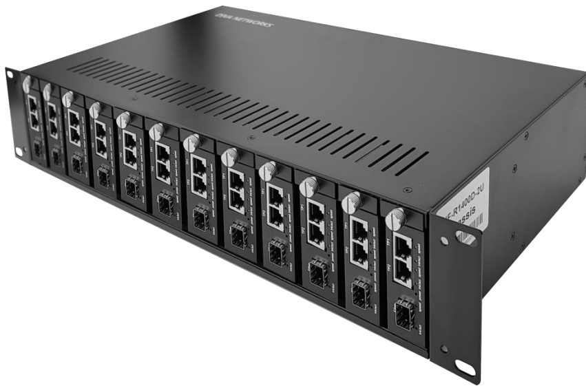
429 x 230 x 90 mm

전용 집합형 샤시를 사용하면 센터에서 여러 대의 미디어 컨버터를 집중화하여 효율적으로 운용할 수 있습니다. 최대 14개의 DIVA-ME 시리즈를 집합형 샤시에 장착할 수 있으며 AC 전원을 이중으로 연결하여 안정성을 향상시킵니다. 전용 집합형 샤시는 2U 사이즈로 19인치 랙 장착 구조를 제공합니다.