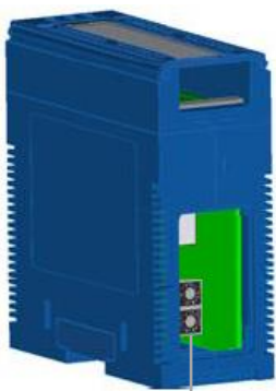
Modbus Slave ID

2개의 로터리 스위치를 통해 모드버스 아이디를 간편하게 변경할 수 있고 리셋 스위치를 3초 이상 누르면 설정값이 초기화 됩니다. 사용자가 설정을 변경하면 설정값이 EEPROM 메모리에 자동으로 저장됩니다. 따라서 파손된 모듈을 교체할 경우 EEPROM 메모리 슬롯만 교체하여 현장에서 신속하게 기존 설정을 복구할 수 있습니다.